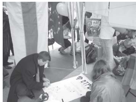
Tarptautiniai mokymai „Bridges of democracy“