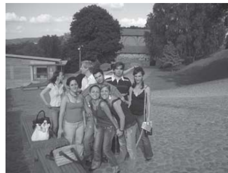
Tarptautiniai mokymai „Make it visible“

LiJOT atstovai šiemet dalyvavo Marijampolės, Vilniaus, Alytaus apskričių jaunimo konferencijose, kur pristatė LiJOT veiklą, moderavo įvairias darbo grupes, dalinosi jaunimo veiklos patirtimi. Šiemet kartu su JRD buvo suplanuota nuvykti ir susitikti su visais LiJOT nariais „Apskritaisiais stalais“, tačiau dėl VJRT reorganizavimo buvo nuvykta tik į Rokiškio ir Zarasų rajonų „Apskrituosius stalus“ bei susitikta su šių rajonų jaunimo reikalų koordinatoriais, aptartos bendradarbiavimo su savivaldybe galimybės, jaunimo politikos įgyvendinimas. LiJOT buvo partneris