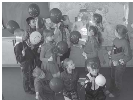
Viena geriausių konkurso jaunimui „Mano Europa“ nuotraukų

Nuo balandžio mėnesio Utenos regioninės televizijos eteryje transliuojama Eurodesk Lietuva reklama. Kadangi informavimas televizijos eteryje duoda efektyvių rezultatų, pradėtas bendradarbiavimas su kitų regionų televizijomis, siekiant ir jų eteryje transliuoti Eurodesk reklamą nemokamai. Minint Lietuvos įstojimo į ES antrąsias metines, bendradarbiaujant su Europos Komisijos atstovybe Lietuvoje bei Europos informaciniais centrais, Europe Direct – buvo organizuotas fotografijų konkursas jaunimui „Mano Europa“. Konkurso nugalėtojų darbų paroda visą vasarą keliavo per daugelį Lietuvos miestų, kartu informuodama jaunimą ir apie Eurodesk Lietuva informacinį portalą bei jo teikiamas paslaugas ir informaciją. Geriausių konkurso darbų paroda buvo eksponuojama Europos Komisijos atstovybėje Lietuvoje, Klaipėdos, Panevėžio, Šiaulių, Tauragės, Alytaus, Marijampolės, Telšių, Utenos Europe Direct informacijos centruose, Eurodesk regioninių partnerių organizacijose Šakiuose, Utenoje, Zarasuose bei Naujojoje Akmenėje. Renginys susilaukė labai didelio visuomenės dėmesio bei teigiamo dalyvių bei aplinkinių įvertinimo.