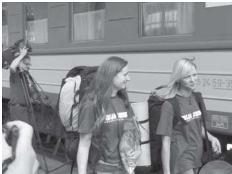
„Misija Sibiras“ dalyviai

džiosios Britanijos, Jungtinių Amerikos Valstijų, Vokietijos, Kipro, Izraelio, Japonijos, Australijos, Rumunijos, kitų šalių. Tai įrodo, kad žinia apie projektą pasiekė ir mūsų tautiečius, šiuo metu išvykusius iš Lietuvos, kurie domisi savo šalies istorija.