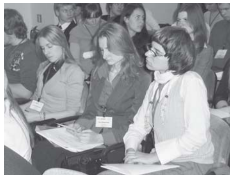
19-oji (rudens) Asamblėja