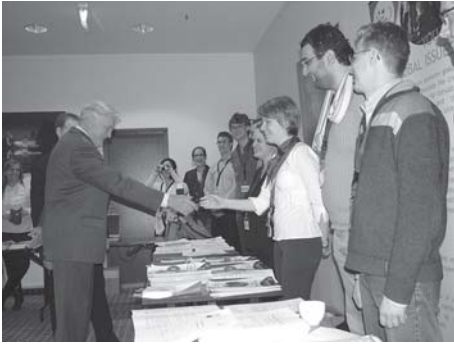
Europos jaunimo forumo Generalinė Asamblėja

Teisės Klinikos įgyvendinimo projekto, kuriuo siekiama sukurti teisi- nių konsultacijų sistemą jaunimo organizacijoms ir padėti išikurti nau- jiems „Apskritiesiems stalams“.