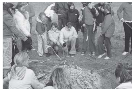
Šiaulių jaunimo darbo centro grupės išvyka į savaraišinius mokymus Kulautuvoje