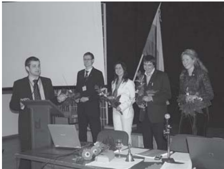
18-oji (pavasario) Asamblėja

Rezoliucija LiJOT ragina atsakingas institucijas įtraukti jaunimo atstovus į „Vilnius – Europos kultūros sostinė 2009“ programos valstybinę komisiją, direktijos tarybą bei ekspertų komisijas, kad būtų užtikrintas kuo platesnis bei efektyvesnis Lietuvos ir Europos jaunimo dalyvavimas programos renginiuose. LiJOT pateikė siūlymus „Vilnius – Europos kultūros sostinė 2009“ programai.