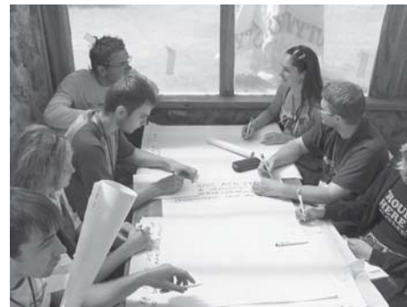
Jaunimo Vasaros Forumas

2006 metais Lietuvos jaunimo organizacijų taryba tęsė Jaunimo diskusijas. Jaunimo diskusijų tikslas – skatinti jaunimo, jaunimo organizacijų ir visuomenės veikėjų dialogą bei diskusijas jaunimui aktualiais klausimais, kelti svarbias visuomenei ir jauniems žmonėms problemas, ieškoti jų sprendimo būdų. Jaunimas šiomis diskusijomis siekia parodyti, jog yra integrali visuomenės dalis, kurios nuomonė turi būti išklaudyta ir į ją reikia atsižvelgti priimant sprendimus. 2006 metais įvyko dvi diskusijos.