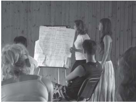
Apskritųjų stalų susitikimas „Apskriticizacija 2006“

tybinės jaunimo politikos regionuose perspektyvoms, žmogiškųjų resursų kaitai, „Apskritųjų stalų“ bendradarbiavimo poreikiui, etikai „Apskrituosiuose staluose“ kaip skėtinėse organizacijose. Susirinkusiems „Apskritųjų stalų“ atstovams buvo pristatytos LiJOT siūlomos priemonės politinių partijų rinkiminėms programoms. Darbo grupėse diskutuota kaip „Apskritieji stalai“ gali daryti įtaką politinių partijų programoms, užmegzti ryšius su politinėmis partijomis.