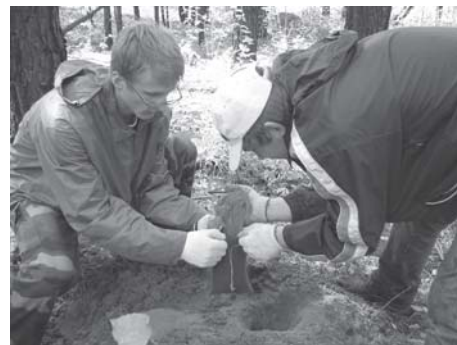
Jaunimas Sibire tvarkė tremtinių kapus