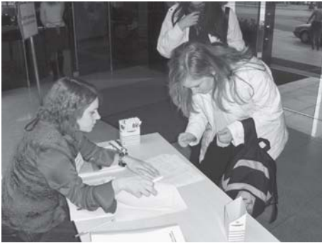
19-oji (rudens) Asamblėja

kokybės standarto kūrimas yra būdas išanalizuoti esamą jaunimo organizacijų būklę, padėti joms gerinti savo veiklą, nubrėžiant tam tikras veiklos gerinimo gaires, parodant silpnašias ir stipriašias organizacijų vietas. Be to, kokybės standarto diegimas yra neatsiejamas nuo jaunimo organizacijų konsultavimo sistemos sukūrimo, kuri padėtų jaunimo organizacijoms taikyti šį standartą ir užtikrintų jų stiprėjimą. Kita vertus, jaunimo organizacijų kokybės standarto parengiamieji darbai 2006 m. sukėlė nemažai diskusijų jaunimo organizacijų lyderių tarpe dėl šio standarto turinio pobūdžio ir galimų taikymo galimybių.