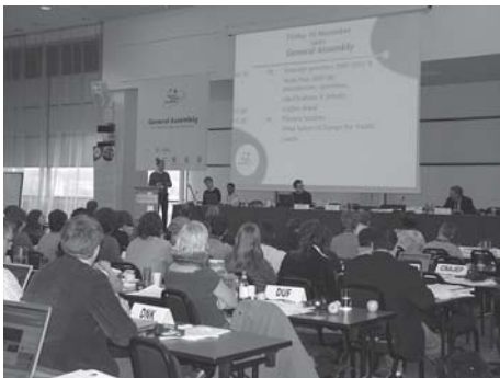
Europos jaunimo forumo Generalinė Asamblėja

Socialinės atskirties mažinimo srityje organizacija įgyvendino du projektus: „Lietuvos savanorystės tinklas“ ir dar tebevykstantį Europos Bendrijų iniciatyvos EQUAL projektą „Lietuvos jaunimo užimtumo tobulinimo vystymo bendrija“. Pirmasis projektas buvo skirtas savanorystės plėtrai, o jo metu parengtas nacionalinis savanorystės tinklo modelis, kuris, kaip tikimasi, ateityje bus vykdomas valstybės. Antrasis projektas sėkmingai vykdo vieną iš etapų, kurio metu įgyvendinama užimtumo veiklos programa, rengiami tyrimai, darbo grupių susitikimai, vykdoma tarptautinė veikla.