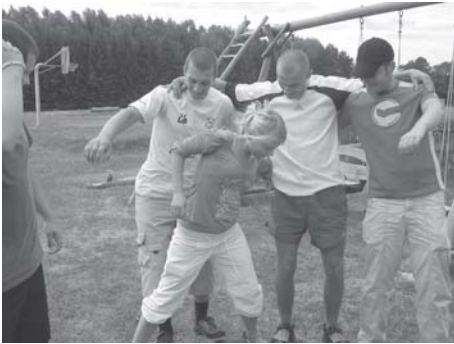
Panevėžio jaunimo darbo centro grupės dalyvių mokymai Aukštadvaryje

2006 metais vykdyta projekto veikla, kai buvo įgyvendinami projekto tikslai, yra ši: