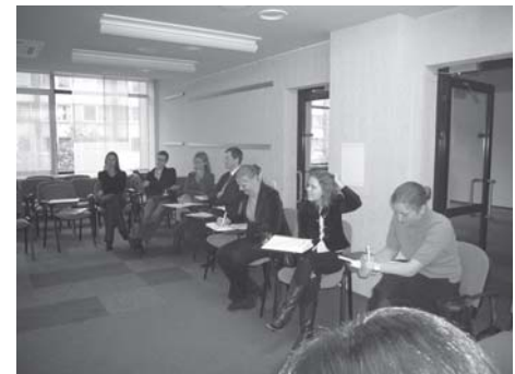
Vadovų klubo susitikimas

neveikia jokie mechanizmai jaunimo organizacijų pasiektiems kokybiniais rezultatams įvertinti. Taip pat pažymėta, kad nacionalinės jaunimo organizacijos ir „Apskritieji stalai“ turėtų atkreipti dėmesį į finansavimo sutartyse numatytus išpareigojimus JRD (atsiskaitymas vykūtų laiku ir t.t.). Kad gerėtų kokybiniai projektų rezultatai, buvo siūloma JRD skirti daugiau dėmesio organizacijų veiklos ataskaitoms, pasiektiems rezultatams ir naujiems keliamiems tikslams vertinti.