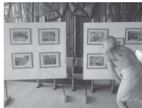
Nuotraukų paroda „Mano Europa“

Visus metus tinklo veikla buvo aktyviai pristatinėjama renginiuose jaunimui – tai ir Lietuvos jaunimo organizacijų tarybos (LiJOT) Asamblėjos bei forumai, įvairūs mokymai, jaunimo nevyriausybinių organizacijų sąjungų „Apskritieji stalai“ suvažiavimas „Apskrtalizacija“, įvairių jaunimo organizacijų renginiai bei vasaros stovyklos. Nacionalinis Eurodesk Lietuva partneris bei tinklo regioniniai partneriai per 2006 metus dalyvavo 38 tokiuose renginiuose, pristatydami tinklo veiklą. Nuolat buvo gaminami ir platinami informaciniai Eurodesk Lietuva lankstinukai – skirtukai. Jie buvo dalijami jaunimui bei žmonėms, dirbantiems su jaunimu, įvairių anksčiau minėtų renginių metu, taip pat organizuojant tinklo veiklos pristatymus regionuose. Eurodesk Lietu-