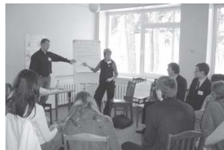
Jaunimo Žiemos Forumas