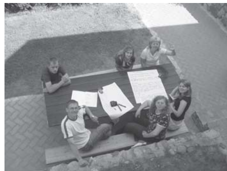
Projekto „Lietuvos jaunimo užimtumo tobulinimo vystymo bendrija“ viešinioji konferencija Jovariškėse, Trakų rajone