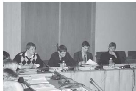
Apskritojo stalo diskusija Seime „Jaunimo ir Seimo bendradarbiavimo 2006 m. gairės“