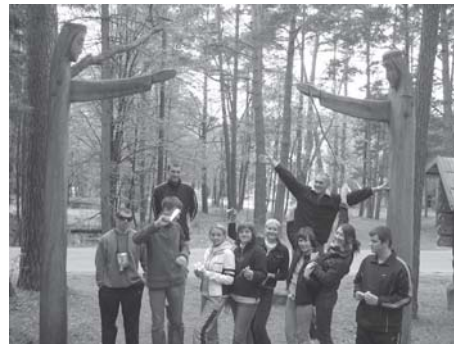
Panevėžio jaunimo darbo centro grupės išvyka į savaitgalinius mokymus Kulautuvoje